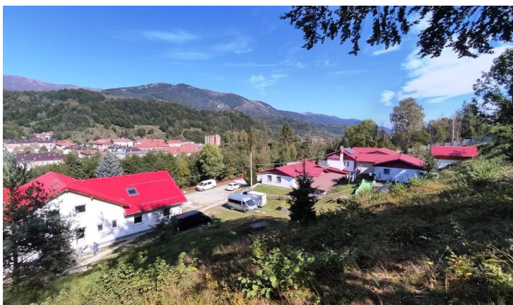
Gelände mit dem ↑ Neubau Oktober 2023

Für die aktuell 18 Kinder und Jugendliche, sorgen 10 Voll- und Teilzeitmitarbeiter rund um die Uhr. Ein neuer Lehrer hat im September seine Arbeit aufgenommen und kümmert sich um Hausaufgabenbetreuung und das Lernen für Arbeiten und Prüfungen.