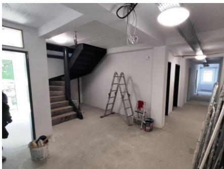
Eingang und Flur

Lampen aufgehängt, 4 WC`s und 4 Bäder gefliest, Zimmertüren und Fensterbänke eingebaut.