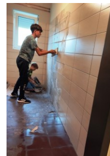
Bei der Arbeit wurden neue Talente entdeckt